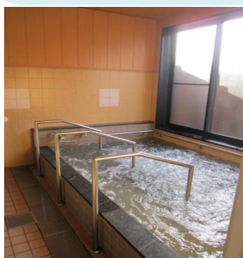
← あったかい天然温泉!(ジャグジー付き)